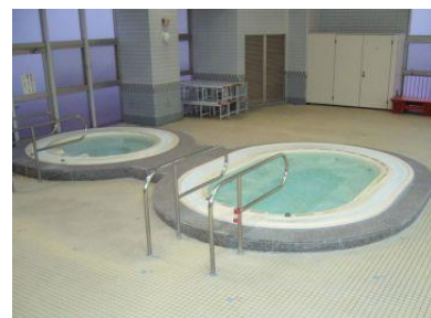
ジャグジー（大・小）