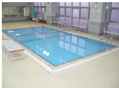
幼児プール（水深30cm・60cm）